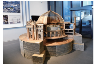
【ブルス・ドゥ・コムルス (30分の1 木模型)】