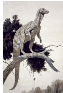
ニーヴ・パーカー《イグアノンの地獄（第三紀の地獄）》1950年代 グアッシュ、インク・紙 52.7x37cm ロンドン自然史博物館