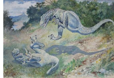
チャールズ・R・ナイト《ドリフトサウルス（飛び跳ねるラエラプス）》1897年 グアッシュ・厚紙 40x58cm アメリカ自然史博物館、ニューヨーク

Image #100205624, American Museum of Natural History Library