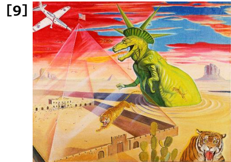
立石紘一《アラモの Sphinxes》1966年 油彩・カンヴァス 130.3×162cm 東京都現代美術館