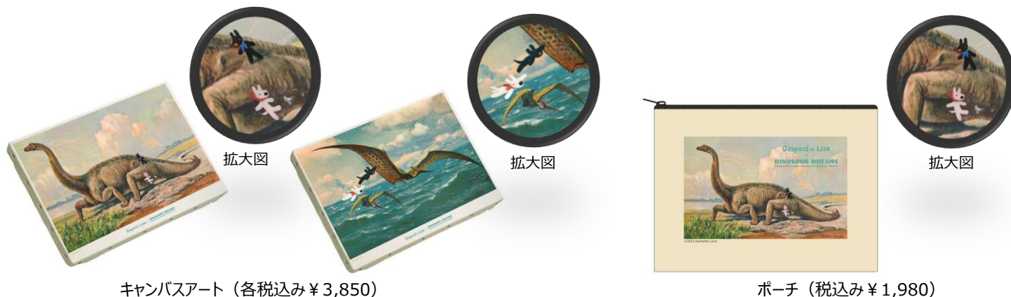
キャンバスアート（各税込み ¥ 3,850）

■フランスの大人気絵本「リサとガスパール」とコラボした、本展限定のキュートなグッズを販売予定です。