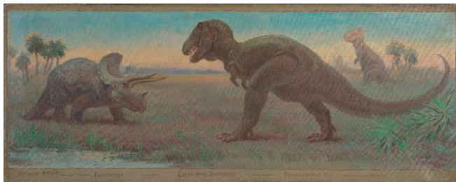
チャールズ・R・ナイト《白亜紀—モンタナ》1928年 油彩・カンヴァス 38.1x96.5cm プリンストン大学