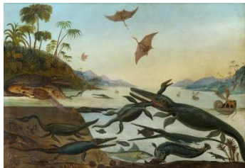
ロバート・ファレン《ジュラ紀の海の生き物—ドゥリア・アンティキオル（太古のドーセット）》 1850年頃 油彩・カンヴァス 190x268cm セジウィック地球科学博物館、ケンブリッジ