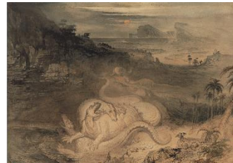
ジョン・マーティン《イグアノンの国》1837年 水彩・紙 30.2x42.6cm ニュージーランド国立博物館・パバ・トンガレウ、ウエリントン