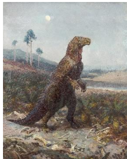
ズデニェク・ブリアン《イグアノンの地獄（第三紀の地獄）》1950年 油彩・カンヴァス 60x48cm モラヴィア博物館、ブルノ

© Jiří Hochman - www.zdenekburian.com/ and Fornuft s.r.o. / Moravské zemské muzeum, Brno