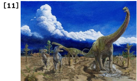
小田隆《緑山層群産動物の生態環境復元画》2014年 アクリル・カンヴァス 115×60cm 丹波市立丹波電化石工房 ©小田隆/丹波市