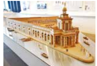
【Punta della Dogana 模型(30分の1 木模型)】