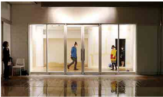
(図6) 【参考図版】 飯川雄大《デコレータークラブ 配置・調整・周遊》2020年 ヨコハマトリエンナーレ 2020「AFTERGLOW-光の破片をつかまえる」の展示風景 (2020)