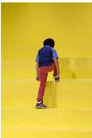
(図8) 【参考図版】 飯川雄大《デコレータークラブ -知覚を拒む》2019年 札幌文化芸術交流センターSCARTS「まなぎのスキップ」の展示風景 (2019)