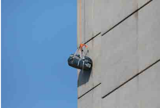
(図2) 【参考図版】 飯川雄大《デコレータークラブ -0人もしくは1人以上の観客に向けて-》2021年 千葉市美術館つくりかけラボ04の展示風景 (2021)