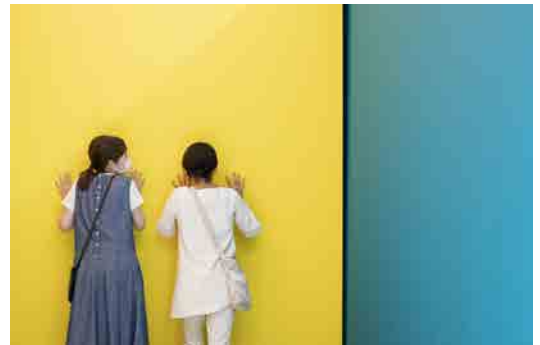
(図7) 【参考図版】 飯川雄大《デコレータークラブ 配置・調整・周遊》2020年 ヨコハマトリエンナーレ 2020「AFTERGLOW-光の破片をつかまえる」 の展示風景 (2020)