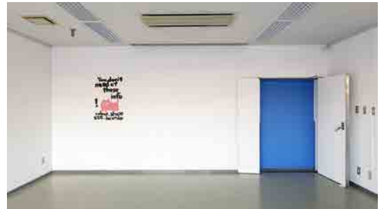
(図5) 【参考図版】 飯川雄大《デコレータークラブ 配置・調整・周遊》2018年 あまらぶアートラボ A-Labの展示風景 (2018)