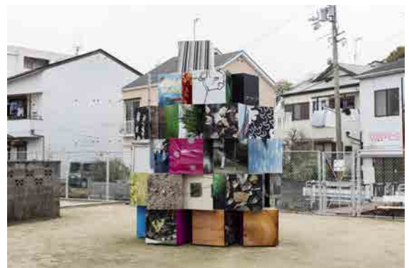
(図9) 【参考図版】 飯川雄大《デコレータークラブ -衝動とその周辺にあるもの》2016年 塩屋東市民公園の展示風景 (2016)