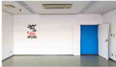
「デコレータークラブ 距離・経路・時間」2019年 兵庫県立美術館4F 100号展示室