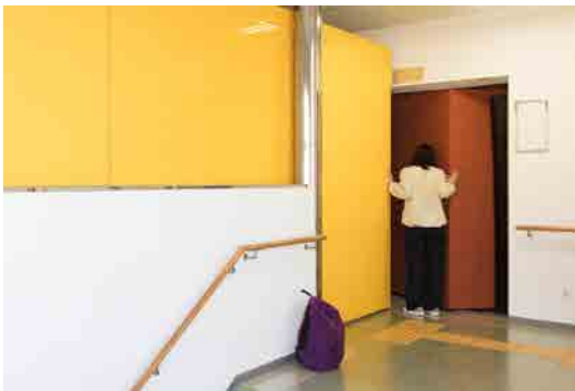
(図4) 【参考図版】 飯川雄大《デコレータークラブ 配置・調整・周遊》2018年 あまらぶアートラボ A-Labの展示風景 (2018)