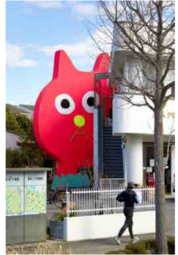
(図3) 【参考図版】 飯川雄大《デコレータークラブ -ピンクの猫の小林さん》 並木クリニック中庭の展示風景 (2020)