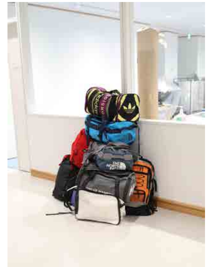
【図1】【参考図版】 飯川雄大 千葉市美術館 つくりかけラボ04 「デコレータークラブー0人もしくは1人以上の観客に向けてー」 の設営風景(2021)