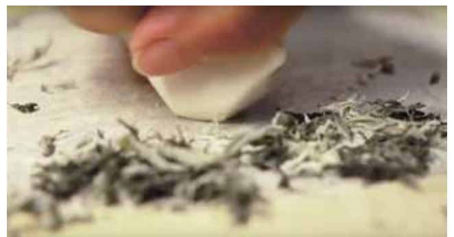
6) 入江早耶 制作風景