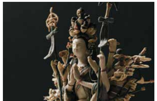
参考図版) 入江早耶《カンノンダスト(菊理媛命)》2018年 掛軸、消しゴムのカス