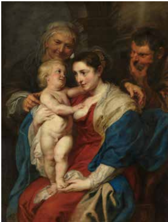
18) ペーテル・パウル・ルーベンス《聖アンナのいる聖家族》 1630年頃 マドリッド、プラド美術館蔵