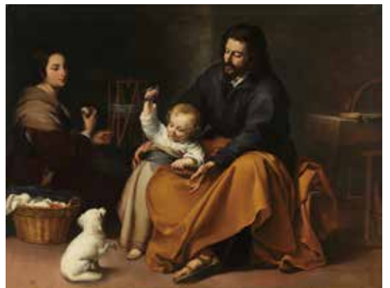
17) バルトロメ・エステバン・ムリーリョ《小鳥のいる聖家族》 1650年頃 マドリッド、プラド美術館蔵