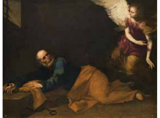
16) ジュゼペ・デ・リベーラ《聖ペテロの解放》 1639年 マドリッド、プラド美術館蔵

カトリック教会が対抗宗教改革を推し進めた17世紀は、宗教美術にとって最も実り豊かな時代のひとつでした。教会は、神の教えを正しく、わかりやすく伝え、かつ民衆の心に直接訴えかけるために、美術を最大限活用しました。そのような要請を受けて17世紀初頭にはテネブリズムと呼ばれる明暗のコントラストを強調した写実的な光の表現を特徴とする様式が各地で流行しました。画像面においては、とりわけ熱い信仰を集めた聖母や聖家族、様々な聖人の殉教や幻視といった場面が新たに描かれるようになりました。本章では、スペインを中心に、イタリアやフランドルの作品もあわせ、多様な17世紀カトリック美術を紹介します。