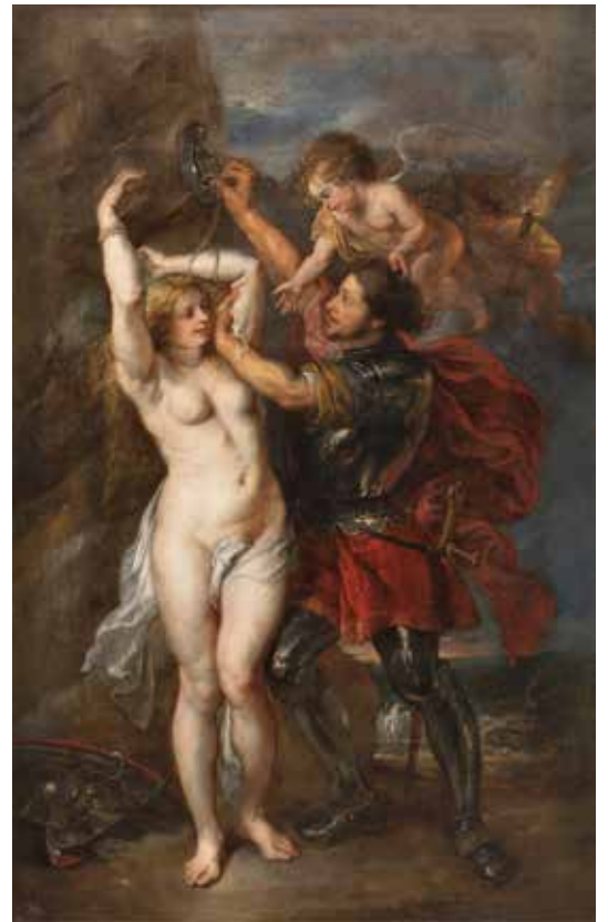
12) ペーテル・パウル・ルーベンス、ヤーコプ・ヨルダーンズ 《アンドロメダを救うペルセウス》1639-41年 マドリード、プラド美術館蔵