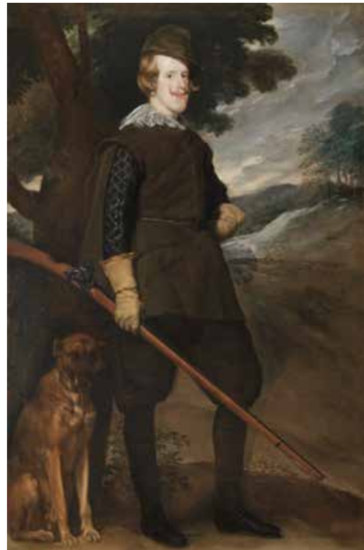
5) ディエゴ・ベラスケス 《狩猟服姿のフェリペ4世》 1632-34年 マドリード、プラド美術館蔵