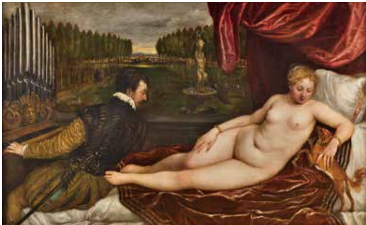
11) ティツィアーノ《音楽にくつろぐヴィーナス》 1550年頃 マドリード、プラド美術館蔵

カトリック教会の影響力が強かった17世紀のスペインでは、裸体画が不道徳とされたため古典古代の神話が主題として描かれることは稀でした。神話主題には裸体人物像が不可欠であったからです。とはいえ、神話画は多くのスペイン王侯貴族によって収集され、限られた場所で享受されており、ティツィアーノやルーベンスの作品を中心とした壮麗なコレクションが形成されました。一方画家たちは裸体表現において、彼等の技量を自在に発揮し美を追究しました。本章では17世紀スペインの宮廷で制作され、受容された様々な神話画を紹介します。