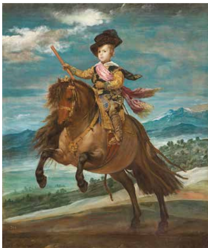
1) ディエゴ・ベラスケス《王太子バルタサル・カルロス騎馬像》 1635年頃 マドリード、プラド美術館蔵

VELÁZQUEZ AND THE CELEBRATION OF PAINTING: THE GOLDEN AGE IN THE MUSEO DEL PRADO