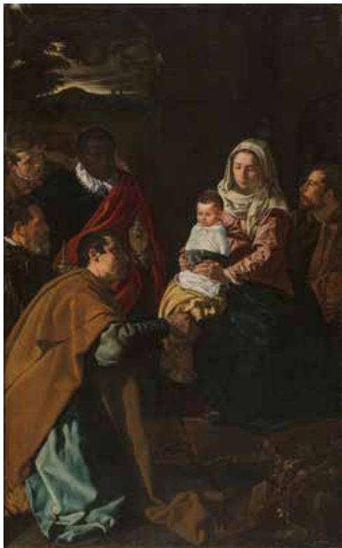
7) ディエゴ・ベラスケス《東方三博士の礼拝》 1619年 マドリード、プラド美術館蔵