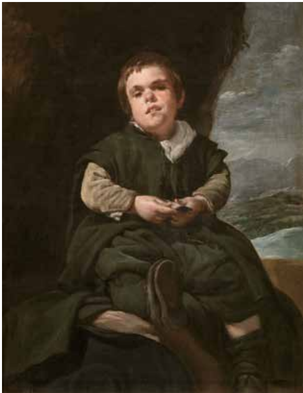
6) ディエゴ・ベラスケス《バリエーカスの少年》 1635-45年 マドリード、プラド美術館蔵