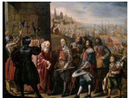
13) アントニオ・デ・ベレーダ《ジェノヴァ救援》 1634-35年 マドリード、プラド美術館蔵

16、17世紀のスペイン宮廷では、国王および国家を称揚するため、また王侯貴族が富や権力を誇示するために、多くの芸術作品が制作され、収集されました。ベラスケスが宮廷画家として仕えた国王フェリペ4世は、稀代のコレクターであり、3,000点を超える数の絵画を収集したとされます。彼はマドリードのアルカサル(王宮)に加え、ブエン・レティーロ宮とトーレ・デ・ラ・パラダ(狩猟休憩塔)という二つの宮殿を造営させ、内部を飾る多くの絵画を国内外から集めました。この章では、肖像画と宮殿装飾という観点から、フェリペ4世の代に描かれ収集された作品を中心に紹介します。