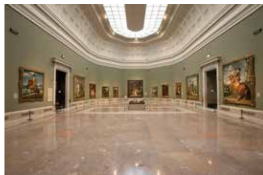
参考)《ラス・メニーナス》など、ベラスケスの傑作群が展示されたプラド美術館第12室

1819年に王立の美術館として開設されたプラド美術館(スペイン・マドリッド)は世界屈指の美の殿堂として知られています。歴代スペイン王によって収集された収蔵品は、ベラスケスやスルバラン、ムリーリョらスペイン人画家による絵画のほか、イタリア、フランドル絵画などヨーロッパ美術の粋を示す第一級の作品から成り、ハプスブルクとブルボンのスペイン王朝の栄華を今に伝えています。本展は、17世紀スペインを代表するのみならず西洋美術史上最も傑出した画家のひとりであり、後世の印象派の画家たちにも大きな影響を与えたベラスケスによる初来日作品を含む7点の重要作品を中心に、イタリアやフランドル絵画をあわせ、61点の油彩画と9点の資料で17世紀スペイン宮廷をめぐる美術を紹介するものです。プラド美術館の核となるベラスケスと17世紀絵画のコレクションを通してスペイン黄金時代の社会と文化に触れる貴重な機会となります。