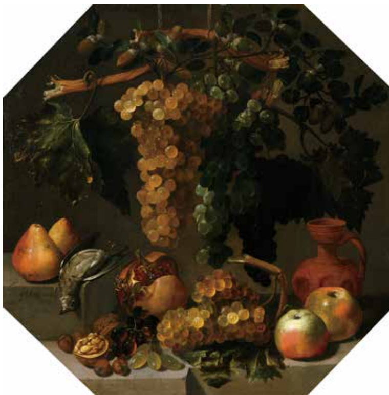
15) ファン・デ・エスピノーサ《ブドウのある八角形の静物》 1646年 マドリード、プラド美術館蔵