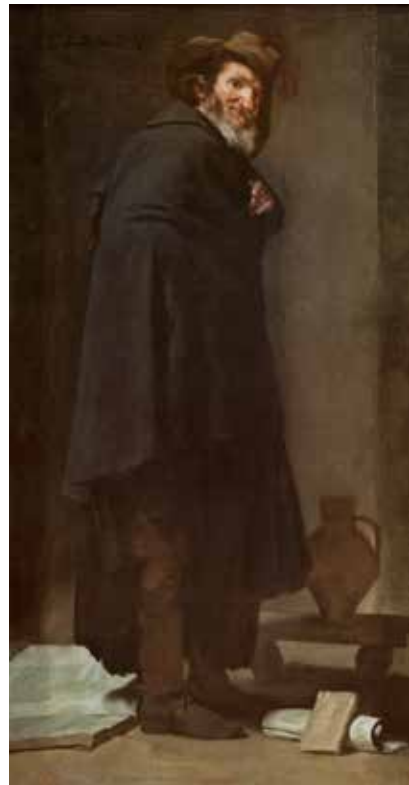
3) ディエゴ・ベラスケス 《メニッポス》 1638年頃 マドリード、プラド美術館蔵