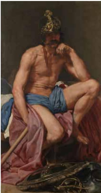
4) ディエゴ・ベラスケス 《マルス》 1638年頃 マドリード、プラド美術館蔵