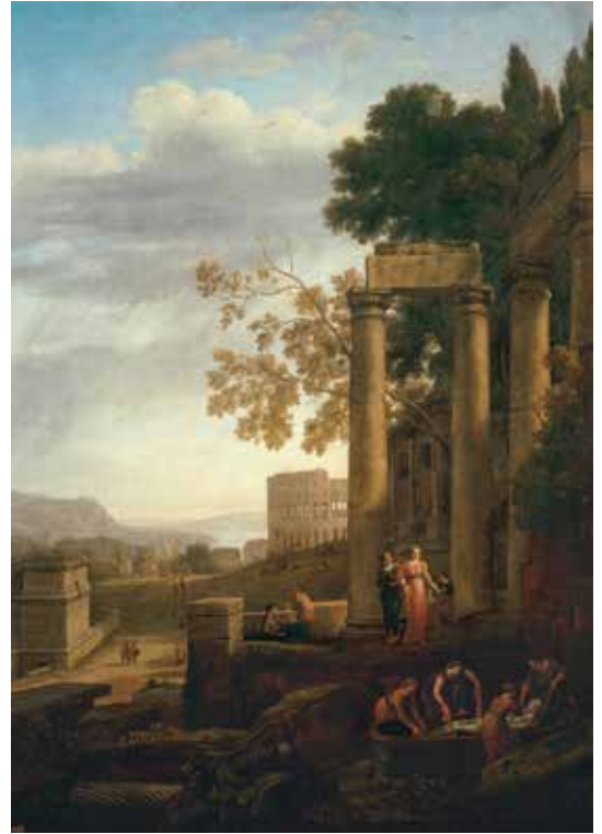
14) クロード・ロラン《聖セラビアの埋葬のある風景》 1639年頃 マドリード、プラド美術館蔵

17世紀のスペインにおいて風景画は他のジャンルほど隆盛はみまみませんでした。スペインの王侯や絵画愛好家たちの間で人気があり、イタリアやフランドルの当時一流の風景画家たちの作品が大量に輸入され、流通していました。そのような状況の下、スペインでも風景画を手掛ける画家が現われました。ベラスケスの肖像画の傑作《王太子バルタサル・カルロス騎馬像》には、背景にマドリード近郊の山並みが流麗な筆致と澄んだ色彩で描かれ、優れた風景表現がみられます。この章では、17世紀スペインで受容された風景画の諸相を、フランドルやイタリア、フランスの作品を交えて紹介します。