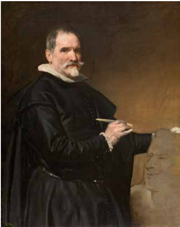
2) ディエゴ・ベラスケス 《フアン・マルティネス・モンタニェースの肖像》 1635年頃 マドリード、プラド美術館蔵