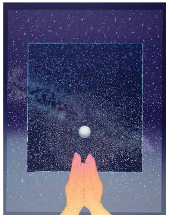
5) 前田常作《瞑想への風景 蓮華光》(1978年)

※この年の主な出来事：サンシャイン 60 が開館。新東京国際空港（現成田国際空港）開港。『未知との遭遇』『スターウォーズ』『さらば宇宙戦艦ヤマト 愛の戦士たち』など SF 映画上映。イギリスで世界初の体外受精児が誕生。日中平和友好条約調印。