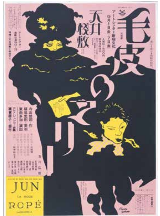
6) 横尾忠則《毛皮のマリー》(1968年)

※この年の主な出来事：チェコでプラハの春が始まる。ベトナム戦争においてテト攻勢開始。成田空港阻止三里塚闘争。テレビアニメ『巨人の星』放送開始。ソニーが「トリニトロンカラーテレビ」を発売。イタイタイ病が公害病に認定される。フランスで5月革命。第8回参議院議員通常選挙で石原慎太郎、青島幸男、横山ノックらいわゆるタレント議員が全員当選。川端康成がノーベル文学賞受賞。国際反戦デーで新宿駅を学生が占拠。三億円事件発生。上山下郷運動始まる。アポロ8号が月の地平線から昇る地球の写真を撮影。