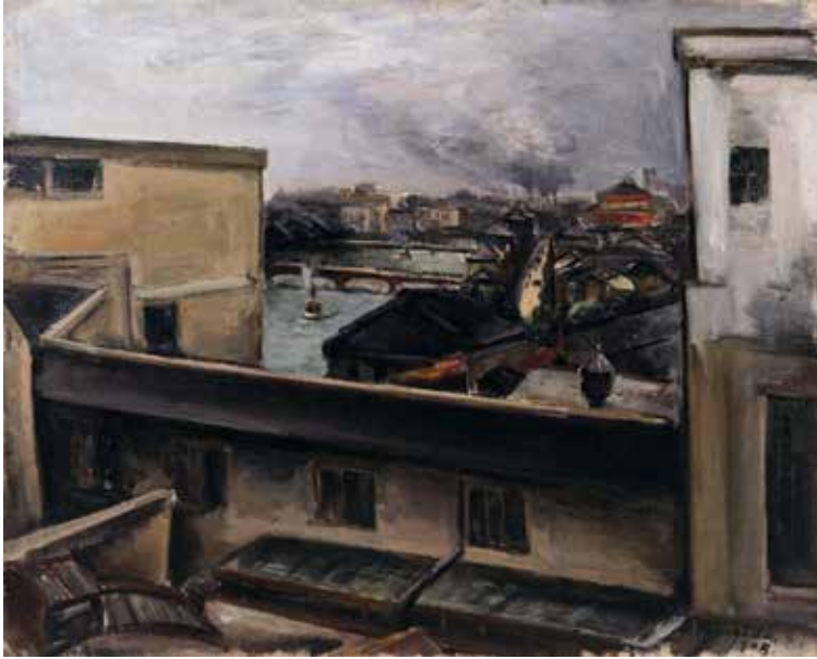
10) 国枝金三《大阪街景》(1928年)

1920年代には近代的な都市が登場し大衆社会と呼ばれる今の私たちの生活の礎が築かれる一方で労働者の権利を訴える労働争議も激しさを増していきます。三・一五事件と呼ばれる日本共産党員に対する一斉検挙事件が起こったのがこの年です。