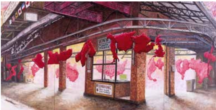
2) 大岩オスカー 《www.com》(2003年) © 大岩オスカー

イントロダクション：メタファーとしての絵画。大岩オスカーの《www.com》は2008年より前に描かれています。しかしながら、2008年に起きた様々な出来事を眺めていると、あたかも彼の作品はこうした事件の数々を予言していたかのようです。もちろんこれは、絵を見る私たちが「あとづけ」しているにすぎませんが、そうしたことを受け入れてくれるだけのゆたかな曖昧さ＝メタファー（暗喩）の力こそがこれらの作品の魅力となっています。