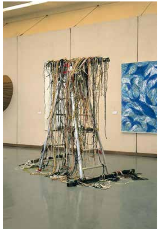
3) 高松次郎 《脚立の紐》(1963-1985年)