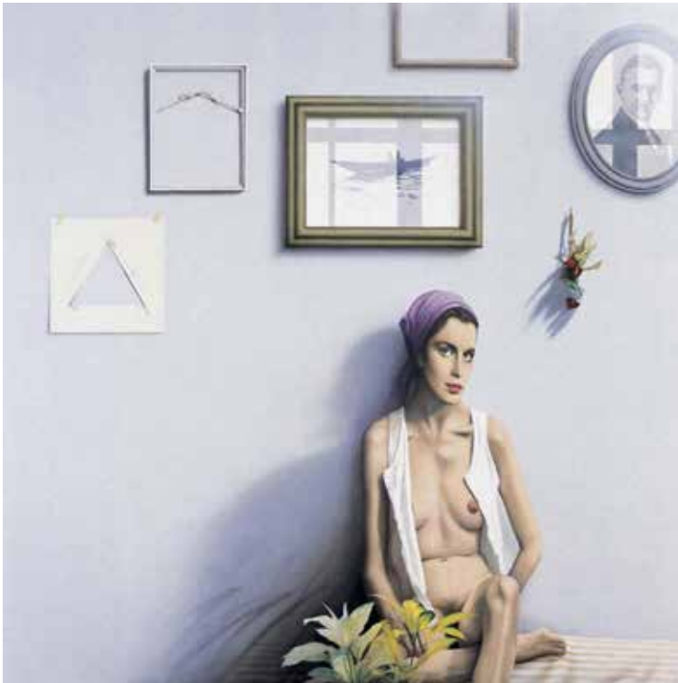
4) 三尾公三《画室の女 (B)》(1988年)