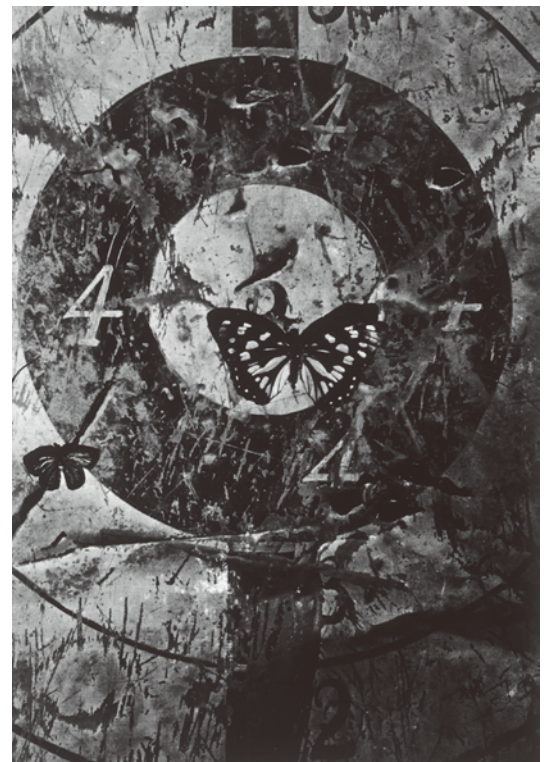
9) 安井仲治《蝶（二）》(1938年) 兵庫県立美術館寄託

※この年の主な出来事：パリのギャラリー・ボザールでシュルレアリスム国際展開幕。ナチス・ドイツ、オーストリアを併合。阪神大水害。アメリカでオーソン・ウェルズ演出のラジオドラマ『宇宙戦争』が放送される。ドイツでユダヤ人への迫害が始まる。渡辺仁設計案の東京帝室博物館本館開館。