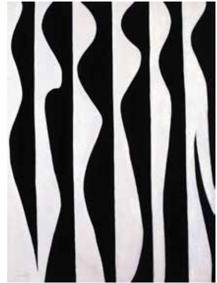
6. 吉原治良《群像》1946年頃

1965年、神戸の若い芸術家9名が結成したグループ〈位〉は、世界とは何かについて、個人ではなく集団で思考し、作品にしました。