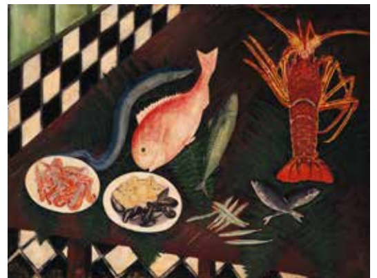
5. 上山二郎《テーブルの魚》1922年