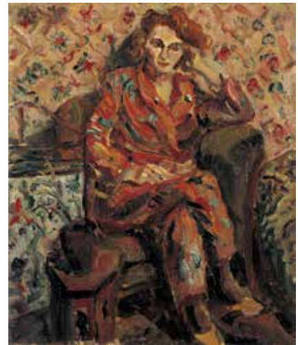
4. 小出檜重《ピジャマの女》1922年