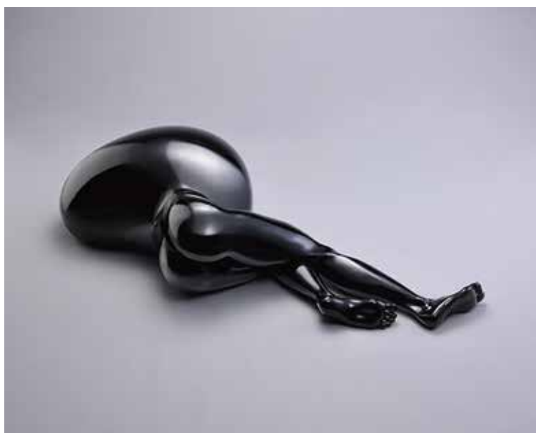
2. 青木千絵《BODY 10-1》2010年