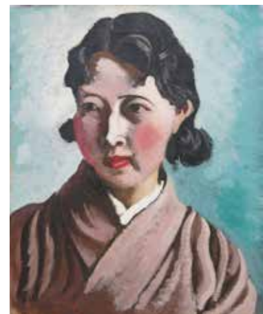
8. 安井曾太郎《女の顔》1931年

安井曾太郎《女の顔》1931年、福田眉仙「中国スケッチ」全12点、和田三造《朝鮮総督府壁画画稿》1926年頃ほか