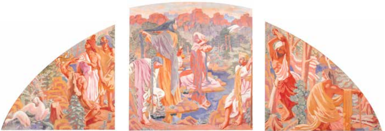
9. 和田三造《朝鮮総督府壁画画稿》1926年頃