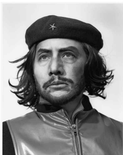
なにものかへのレクイエム(遠い夢/チエ) 2007年 写真

ロシア革命の指導者レーニンは、不況に苦しむ日雇い労働者が集まる大阪の釜ヶ崎に登場します。チャップリンの有名な映画『独裁者』にもとづく映像作品《なにものかへのレクイエム（独裁者を笑え／スキゾフレニック）》では、ヒトラー＝ヒンケル（チャップリン）に扮した森村が、21世紀の独裁者について語ります。元となる過去のイメージに、現代のさまざまなイメージが重ねられることで、過去の記憶は今そして未来へと受け継がれてゆきます。