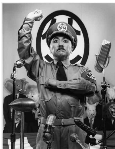
なにものかへのレクイエム(独裁者はどこにいる1) 2007年 写真