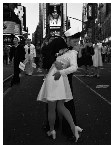
なにものかへのレクイエム (記憶のパレード/1945年アメリカ) 2010年 写真