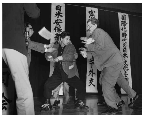
なにものかへのレクイエム(ASANUMA 1 1960.10.12-2006.4.2)2006年 写真