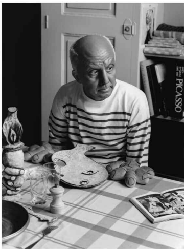
なにものかへのレクイエム (創造の劇場/パブロ・ピカソとしての私) 2010年 写真

ポップアートの巨匠ウォーホルが、女装したウォーホル自身を撮るという映像作品。イヴ・クラインの虚空を跳躍する写真では、舞台であるパリが、どこかなつかしい大阪の風景に入れ替わっています。これらの作品は、森村流の作家論であるとともに、独自の想像的、創造的な美術史を描く試みと言えるでしょう。