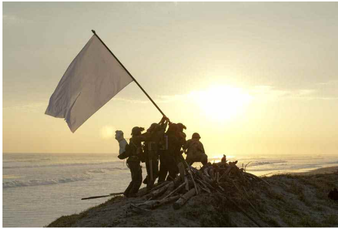
海の幸・戦場の頂上の旗 2010年 映像