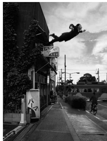
なにものかへのレクイエム (創造の劇場/イヴ・クラインとしての私) 2010年 写真