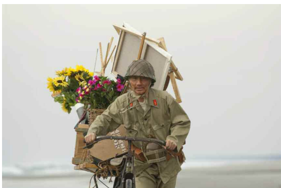
海の幸・戦場の頂上の旗 2010年 映像

映像作品《海の幸・戦場の頂上の旗》では、硫黄島に星条旗を掲げるという有名な一枚の写真から出発し、夢幻劇とも言える世界が繰り広げられます。そこで焦点をあてられているのは、多くの無名の人々です。「あなたなら どんな形の どんな色の どんな模様の 旗を掲げますか。」20世紀とはどのような時代であったのか、という展覧会のテーマを、ひとりひとりのあなた自身の問題として問いかけつつ、展覧会は締めくくられます。