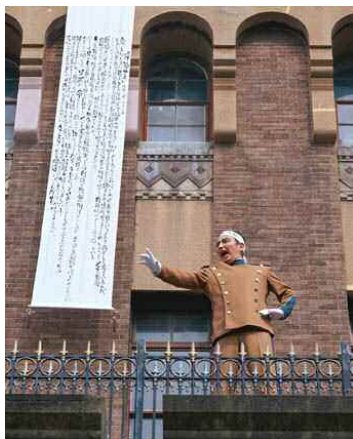
なにものかへのレクイエム(MISHIMA 1970.11.25-2006.4.6)2006年 写真

映像作品《烈火の季節／なにものかへのレクイエム（三島）》で三島となった森村は、現代の芸術を憂い決起を呼びかけて絶叫します。激しく直接的なメッセージは、森村の新たな展開を強く印象づけるものです。