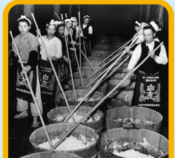
たん ば ち い き 丹波地域 お酒をつくる人 （ とう じ 杜氏）