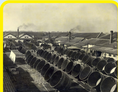
はん しん ち い き さか ぐら 阪神地域 酒蔵