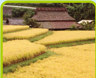
きた はり ま ち いき 北播磨地域 お米（ やま だ に し き 山田錦）