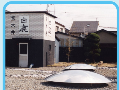
に の み や し 西宮市 お水 （ みやみず 宮水）

ざいりょう お酒づくりの材料であるお米は北播磨地域、 お水は西宮市、つくる人は丹波地域、つくる場所（酒蔵）は阪神地域と、 兵庫県のいろいろな場所がお酒づくりと関係しているのがわかるね。