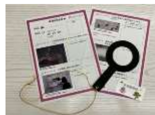
写真⑤調査報告書、紙のルーベ、探検バッジ