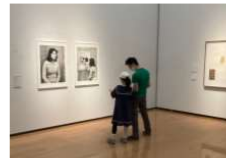
写真② 調査する探偵の様子

調査報告書と、調査に使うアイテムの紙のルーベを持ち、胸元に探検バッジをつけて、いよいよ調査開始！ 展示室でさっそく最初のミッションに関係しそうな作品を発見!!手持ちのルーベを使い、右から左から、上から下から、じっくりと作品を調査をしている姿が、まるで本物の探偵のようにかっこよかったです。