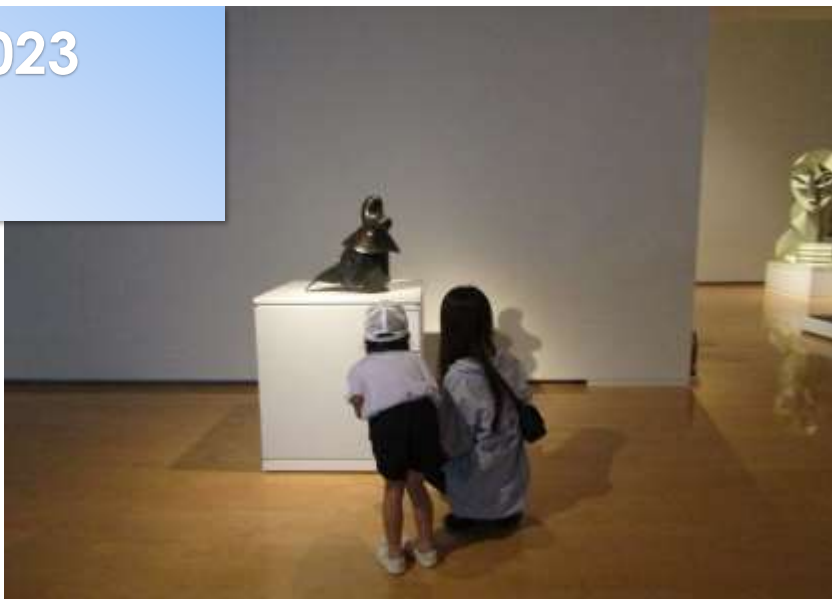
写真①調査する探偵の様子