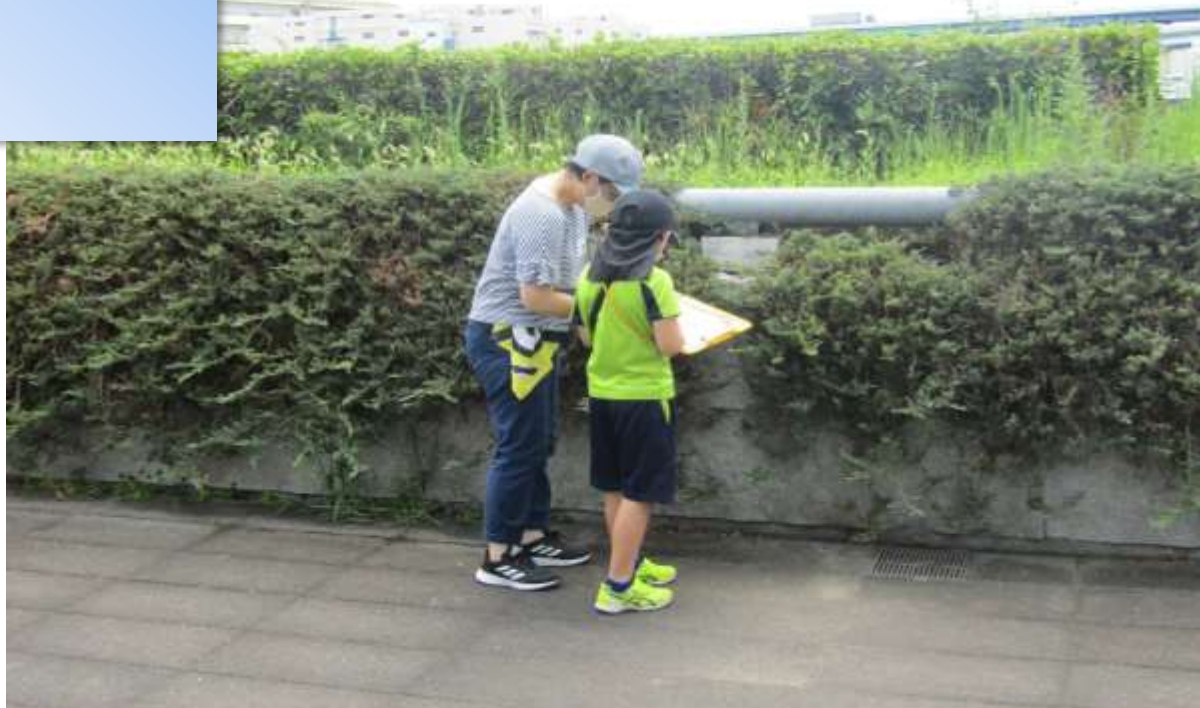
こどものイベント