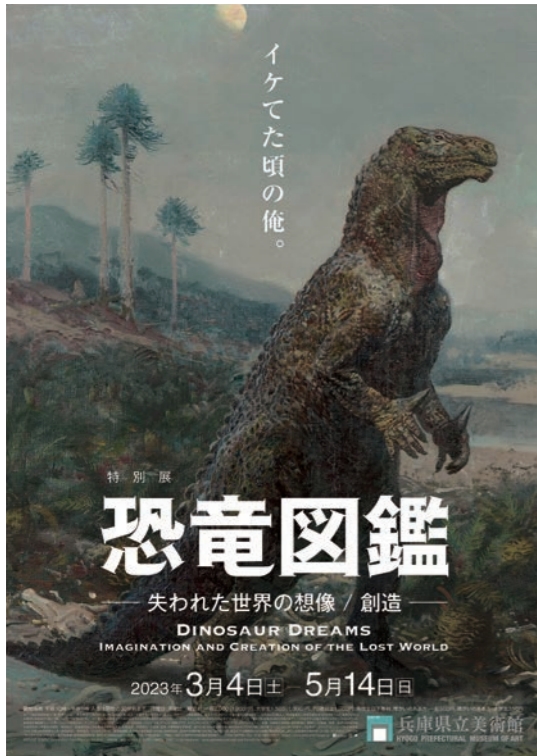
恐竜図鑑—失われた世界の想像/創造 ポスター

は、自然系の博物館やイベントホールを会場とし、化石標本や骨格模型を主な出品物とする場合がほとんどであろう。化石や骨格の横に添え物のように置かれる復元画に焦点を当てる美術展ということであれば、少なくとも国内での先行事例はあまり聞いたことがない。