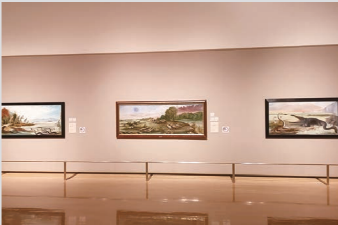
会場風景 (ベンジャミン・ウォーターハウス・ホーキンス)

とにかく、出品候補を集めるには圧倒的にデータが不足していたのだが、そんな状況下で、作品選定の指針となるようないくつかの書籍と出会えた