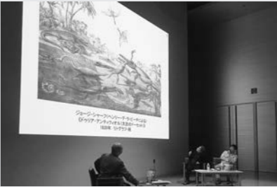
記念トークショー