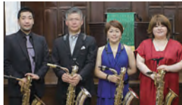
神戸バリトンサクスクラブ

<演奏曲目> バッハ「イタリヤ協奏曲 BWV971」/ビゼー「カルメン・ファンタジー」/米山正夫「りんご追分」ほか