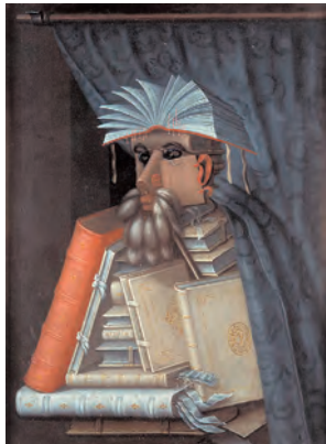
ジュゼッペ・アルテンボルド 《司書》 1566 年頃 スウェーデンのスコークロステル城(スウェーデン)蔵

2009年、記録的な入場者を迎えた「だまし絵」展の第2弾。視覚的なイリュージョンを用いた巨匠アルテンボルド、マグリット、ダリらの名品に加え、今回はホックニー、リヒター、杉本博司など、現代の多様なトリック的表現を紹介。だまし絵の不思議な世界をご家族全員でお楽しみください。