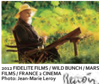
2012 FIDELITE FILMS / WILD BUNCH / MARS FILMS / FRANCE 2 CINEMA Photo: Jean-Marie Leroy