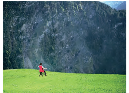
ツェ・スーメイ 《エコー》 2003 © Su-Mei Tse