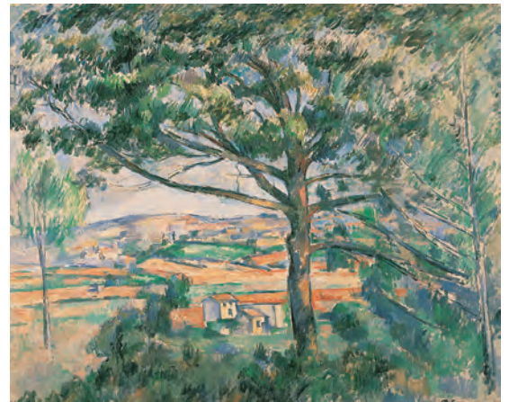
ポール・セザンヌ 《大きな松と赤い大地(ベルヴュ)》 1885年頃

ある収集家が、フランスへの夢と憧れを抱いて集めたフランス近代絵画のコレクションから名品71点をご紹介します。モネ、セザンヌ、シスレーといった印象派の画家の描く美しい大地の眺め、モディリアーニ、キスリング、藤田嗣治などエコール・ド・パリの画家たちが愛した哀歎に満ちた女性たち、ヴラマンク、ユトリロらの描く孤独な路上の風景の魅力、今一度、ゆっくりと味わっていただけることでしょう。