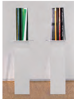
イザ・ゲンツケン 《無題》 2006 © Isa Genzken/Courtesy Galerie Daniel Buchholz, Cologne/Berlin Photo © Centre Pompidou, MNAM-CCI / Georges Meguerditchian / Dist.RMN-GP