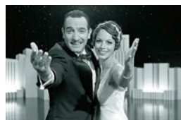
① La Petite Reine - Studio 37 - La Classe Americaine - ID Prod - France 3 Cinema - Jouror Productions - ufilm

1920年代、ハリウッド黄金期。サイレント映画の大スター、ジョージは新人女優ペビーを見初め、彼女を人気女優へと導いていく。惹かれあう二人。折しも映画産業界はトーキーへの移行期。 ① La Petite Reine - Studio 37 - La Classe Americaine - ID Prod - France 3 Cinema - Jouror Productions - ufilm ② (2011年 フランス映画) ミュージアムホールにて 1回目 10:30 / 2回目 13:00 / 3回目 15:30 (各回入れ替え) 1人 1,000円