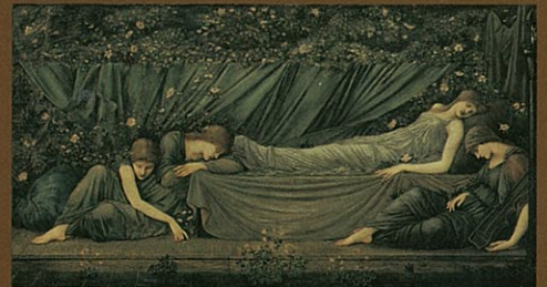
《眠り姫》— 連作「いばら姫」 1872-1874年頃、ダブリン市立ヒュー・レイン美術館 (ダブリン)

エドワード・バーン=ジョーンズ (1833～1898) は、19世紀末のイギリス唯美主義美術を代表する画家であり、師ロッセティらが結成したラファエル前派の系譜に連なる最後の巨匠です。ギリシャ神話や中世文学の主題を描いた作品は、甘美な幻想に満ちた世界へと見る者を誘います。本展は日本で初めての本格的なバーン=ジョーンズ展であり、西日本での会場は当館のみとなります。わずか 38 日間だけの開催ですので、どうぞお見逃しなきように!!