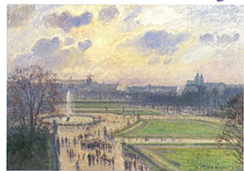
カミーユ・ピサロ 《チュイルリー公園の午後、太陽》1900年 サントリー・コレクション