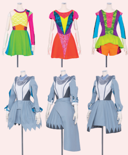
上: Perfume 3rd Tour 「JPN」 2012年 下: Future Pop 2018年 いずれも『Perfume COSTUME BOOK 2005-2020』より

3人組ユニットPerfumeが着用した楽曲・ライブ衣装約170着を紹介する初の 大規模衣装展です。2005年のメジャーデビュー以降の761着の衣装を解 説した『Perfume COSTUME BOOK 2005-2020』(文化出版局、2020 年)。楽曲の世界観を表現し、踊る姿を美しく飾るPerfume衣装の魅力を紹介 します。衣装の変遷をたどるだけでなく、3人のメンバーがこの展覧会のた めに特別に選んだライブ衣装も展示します。