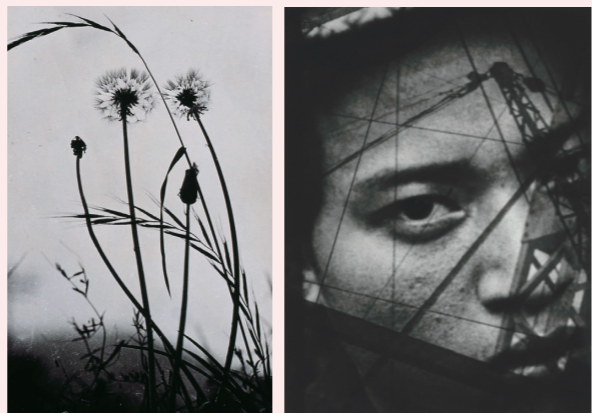
《草》 1929年頃 セラチンシルバープリント 個人蔵 (当館寄託) 《凝視》 1931/2023年 個人蔵

日本の写真史の中でも傑出した存在として知られる安井仲治 (1903-1942)。約20年という短い活動期間にも関わらず、あ らゆる対象にカメラを向けながら、現実の断片から強烈な象徴性を とらえて作品としました。本展では戦災を免れたヴィンテージプリ ントとネガの調査を元に、安井の活動のさらなる解明を試みます。 写真がフィルムからデジタルへと変わり誰もが写真を撮るようにな った今だからこそ、100年の時を超えて、安井の写真は私たちの 心をとらえるでしょう。