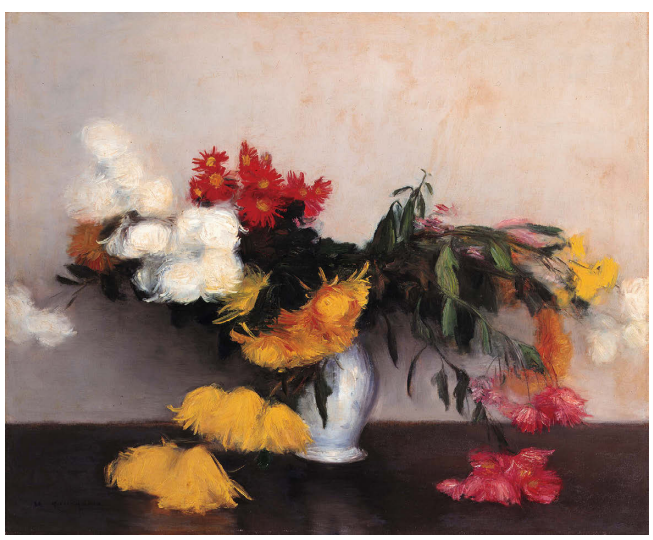
金山平三《猫》1901年頃 油彩 キャンバス 当館蔵