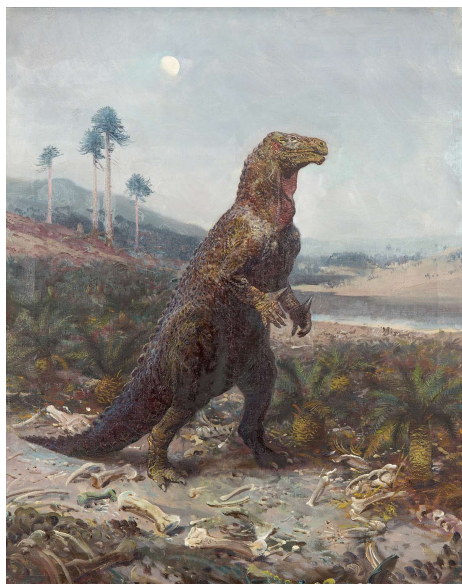
ステエック・ブリアン・イヴァノフ・ヘルゴルテンシス 1950年 油彩・カンヴァス プラハ・アム博物館、ブルノ