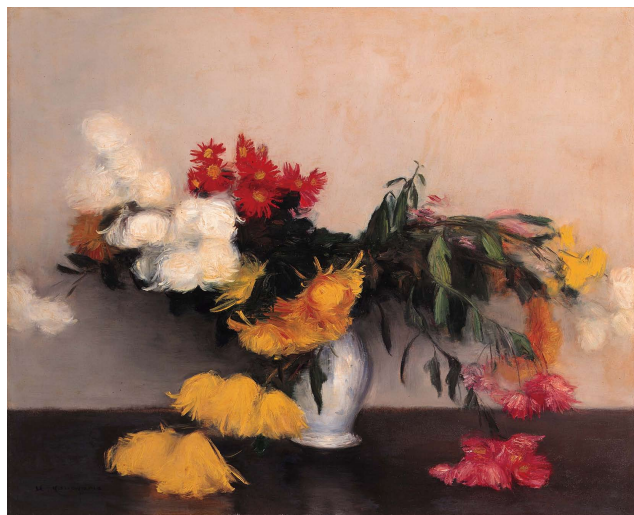
金山平三 (菊) 1921年頃 油彩・布 当館蔵