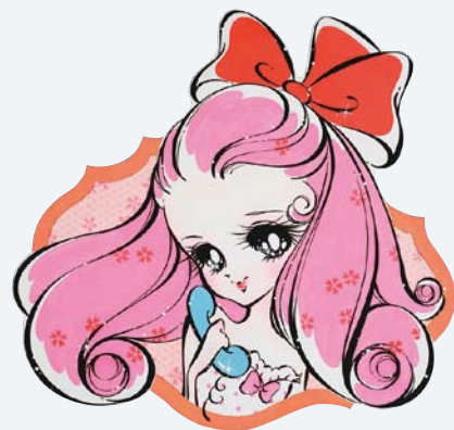
西山美奈「ハルイわたし」© 2009年 令和3年 展大和神田氏贈呈 ©Minako Nishiyama