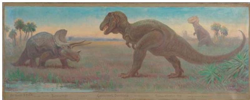
チャールズ・R・ナイト (白亜紀—モンタナ) 1928年 油彩・カンヴァス プリンストン大学美術館