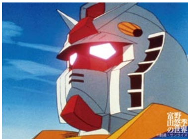
「機動戦士ガンダム」

「鉄腕アトム」の演出でアニメ界にデビューし、「機動戦士ガンダム」、「ガンダム Gのレコンギスタ」などのガンダムシリーズ、「伝説巨神イデオン」、「聖戦士ダンバイン」といった数多くのオリジナルアニメーションの総監督を務め、国内外のアニメーションに多大な影響を与えてきた、富野由悠季監督(1941-)のこれまでの仕事を回顧、検証する初の展覧会です。日本のアニメ界をけん引し全世代にファンを持つ富野監督作品の魅力を余すところなく紹介します。