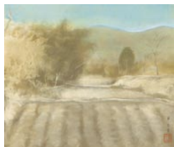
村上華岳《早春風景》1919年 絹本着彩(前期展示)

兵庫県ゆかりの日本画家、村上華岳(1888-1939)の画業を当館のコレクションでたどります。(前期展示:7月6日(土)～9月8日(日)、後期展示:9月10日(火)～11月10日(日))