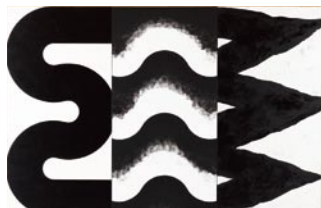
菅井汲《空の怒り》1986年 油彩・アクリル・布

ジャンルや時代の異なる当館=県美(けんび)の多彩なコレクションを8つの「景色」に見立て、2018年度に新たに収蔵された作品をそれぞれの「景色」の中で紹介します。