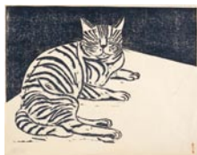
前川千帆《猫》1959年 木版・紙

ジャンルや時代の異なる当館＝泉美(けんび)の多彩なコレクションを8つの「景色」に見立て、2018年度に新たに収蔵された作品をそれぞれの「景色」の中で紹介します。