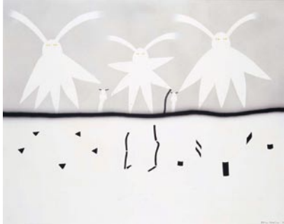
中辻悦子《内外》1983年 アクリル・布 山村コレクション

当館コレクションから多様なジャンル・時代の名品を、「境界」にかかわる6つのテーマに沿って展示します。