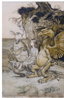
アサー・ラッカム 《ニセウミガメ》1907年 ©The Korshak Collection

ギャラリー棟3階にて 入場料:一般1,400円、 大生1,000円、 小・中学生600円